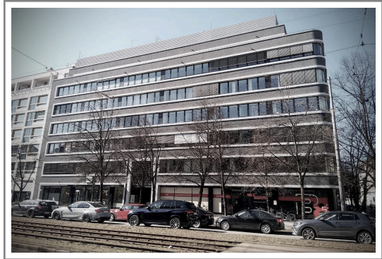
Bayerisches Oberstes Landesgericht (BayOLG) München

ziehende Strafprozess gegen Braun, von Erffa und Bellenhaus half bequem, alles Richtung Verjährung zu schieben. Dr. Brauns Rechtsschutzversicherung war im Frühjahr 2024 schon ausgelaufen; er wurde danach von zwei engagierten, manchmal sichtbar frustrierten Pflichtverteidigern vertreten.