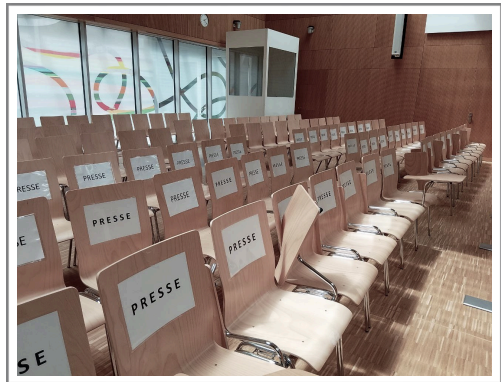
Pressebereich im Stadelheim-Gerichtssaal

W ar der Untersuchungsausschuss die gnadenlose Familientherapie, dann die Mainstream-Presse der Gruppenchat, in dem schon längst feststand, wer schuld ist – man wartete nur noch auf den richtigen Zeitstempel für „Absenden“. An der Spitze, mit dem Selbstbewusstsein eines Mannes, der den Fall angeblich fast im Alleingang geknackt hatte: Dan McCrum von der Financial Times – bald Deutschlands liebster importierter Wahrheitsverkünder und Sammler glänzender Trophäen.