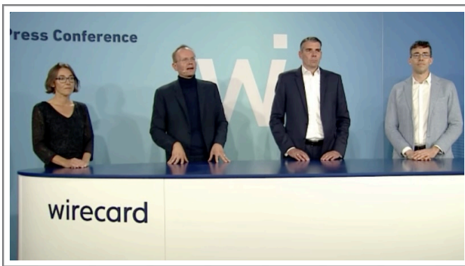
Wirecard Videokonferenz vom 18. Juni 2020

Ich hatte mir das Video angesehen wie einen Unfall in Zeitlupe – nur dass das Auto ein DAX-Schmuckstück im Wert von 20 Milliarden war und der Fahrer brüllte: „Wir könnten Betrugsoffer sein!“, während draußen auf dem Parkplatz bereits Münchner Staatsanwälte herumstanden und sich die Sonne auf die Aktenmappe legte.